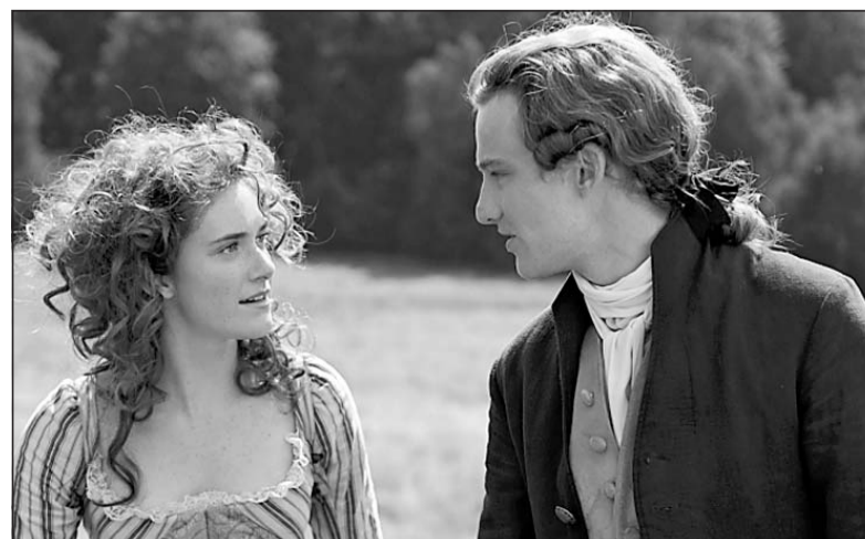
In Wetzlar lernt Goethe (Alexander Fehling) Lotte (Miriam Stein) kennen. Er verliebt sich in sie, obwohl sie verlobt ist.

Einsatz von Farbfiltern wirken die Aufnahmen leuchtend und verblasst zugleich. So fügen sich die historischen Gewänder harmonisch in den Hintergrund ein, ohne dass der Eindruck eines Kostümschinkens entsteht.